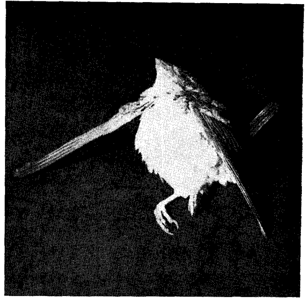
Photos 1 et 2. -Troubles nerveux chez un cou coupé ( Amadina fasciata ) atteint de « bérubéri »

Difco), soit de la thiamine (Merck), soit de la riboflavine (Hoffmann La Roche),